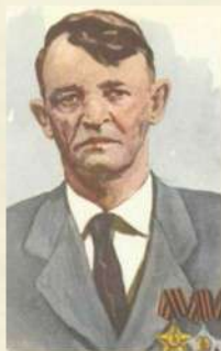
Зилотин М.Н. С. 65