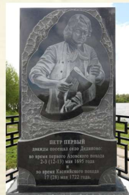
Памятная плита Петру I в. Дединово. С. 75