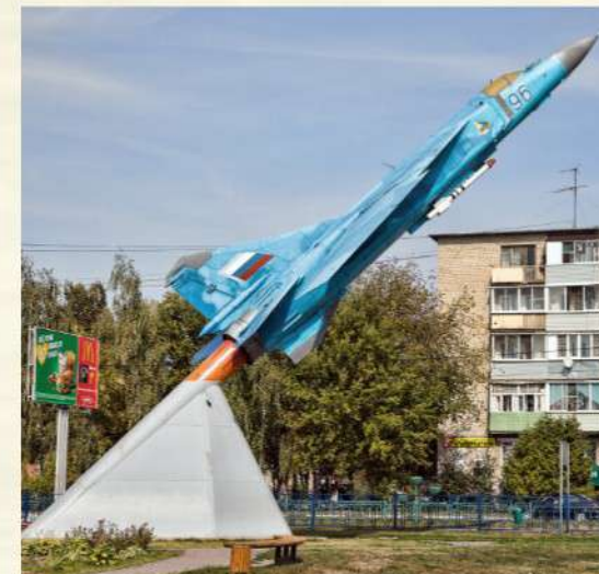
Самолет МиГ-23 — символ г. Луховицы. С. 45