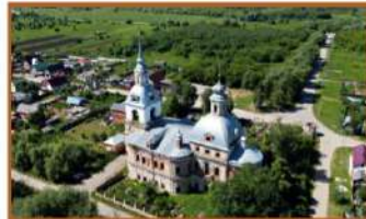
Церковь Воскресения Христова с. Любичи