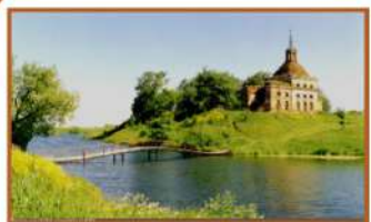
Храм Святой Троицы с. Троицкие Борки

«Край родной: КЗД по городскому округу Луховицы Московской области на 2024 год. – Луховицы, 2023. – С.16»